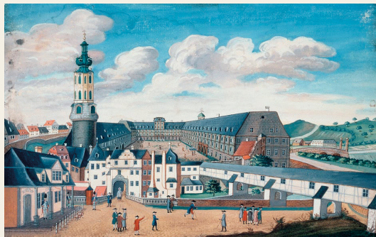
Schloss Wilhelmsburg te Weimar zoals het er uitzag voor de brand van 1774

Bach kende de Duitse muziek van illustere voorgangers als Reinken, Buxtehude en Pachelbel natuurlijk heel goed, maar die was inmiddels wel een beetje uit de mode geraakt. Het hertogelijke hof van Weimar, dat op cultureel gebied Lodewijk XIV navolgde, had al sinds de jaren 1690 grote interesse in Franse muziek. Dat is ook te merken aan de klavecimbel- en orgelwerken die de jonge Bach in Weimar schreef. Die vertonen trekken van populaire Franse componisten als d'Anglebert, Marchand en Couperin.